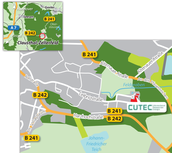
Karten: openstreetmap.de (geändert)

Das Netzwerk Ressourceneffizienz wird von der VDI Zentrum Ressourceneffizienz GmbH koordiniert. Das Netzwerk Ressourceneffizienz wird aus Mitteln der Nationalen Klimaschutzinitiative des Bundesministeriums für Umwelt, Naturschutz, Bau und Reaktorsicherheit finanziert.